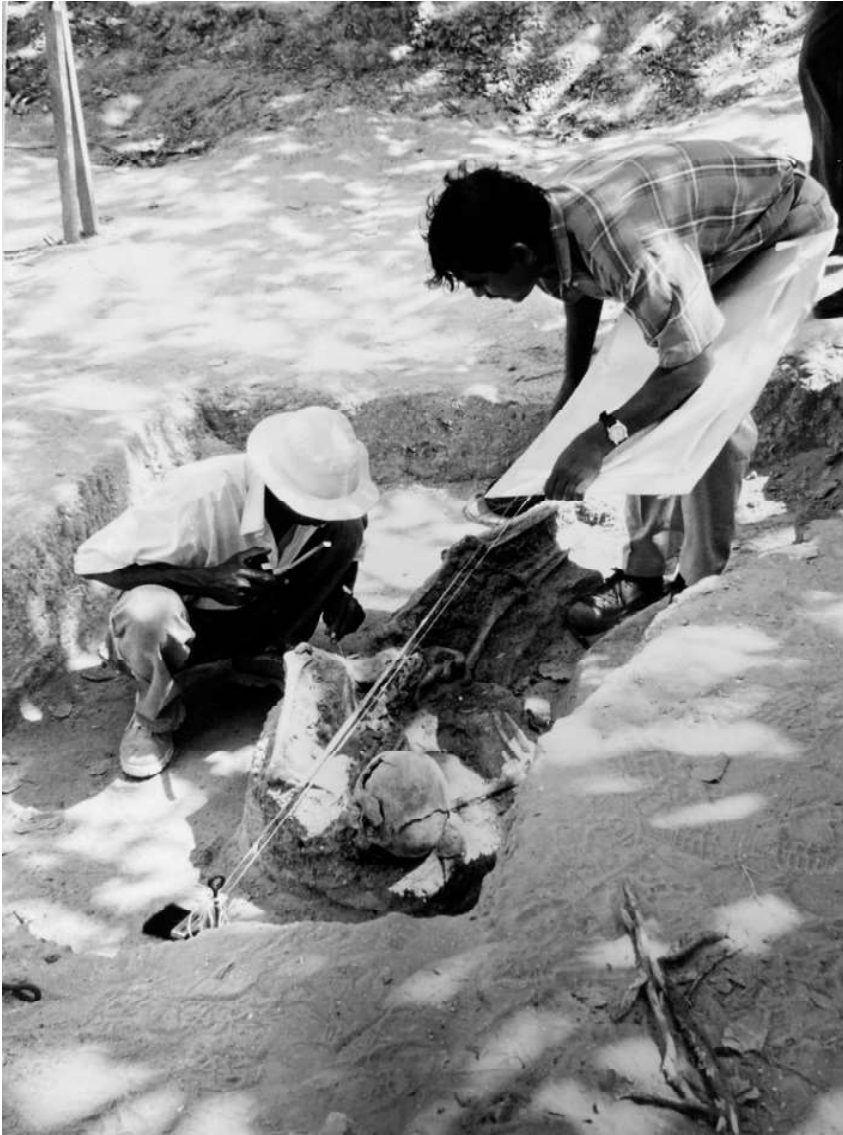
මහාවාරිය වන්දනා නිර්මාණයේදී ඇතුළු වූ චෝනාර්ක විශේෂඥයන් 1999 වෙමිමනි සමූහ මිනිවල ආශ්‍රිත මෘතදේහ ගොඩගැනීමේ කාර්යයෙහි නියැලෙමින්