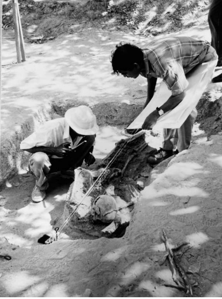
1999இல் செம்மணியில் நடந்த அகழ்வுப் பணியின்போது பேராசிரியர் நிரியல் சந்திரசிறி உள்ளிட்ட தடயவியல் நிபுணர்கள்.